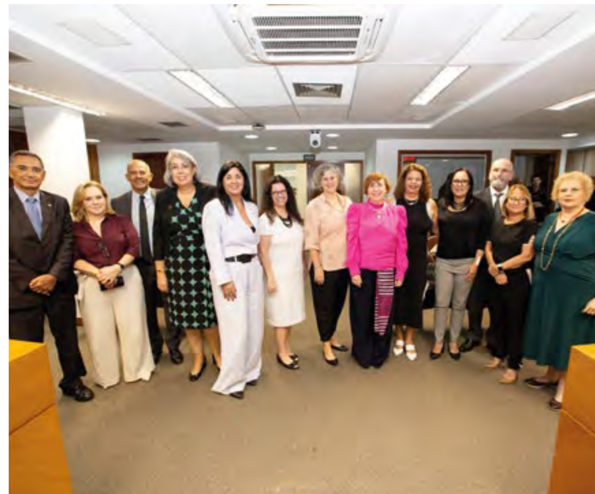
Os procuradores eleitos atuarão no Órgão Especial no biênio 2023/2025