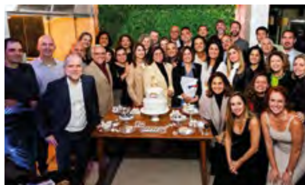
A festividade celebrou quem aniversaria de abril a julho