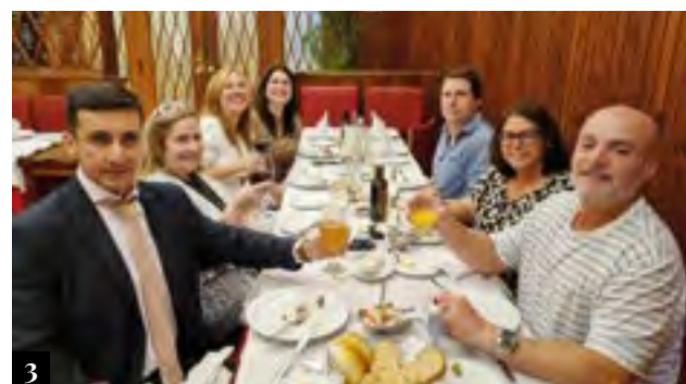
1. Na Amperj, reunião dos colegas de Duque de Caxias e Nova Iguaçu 2. Jantar em Valença reúne associados de cidades do Médio Paraíba 3. Promotores de Justiça se encontram em Petrópolis