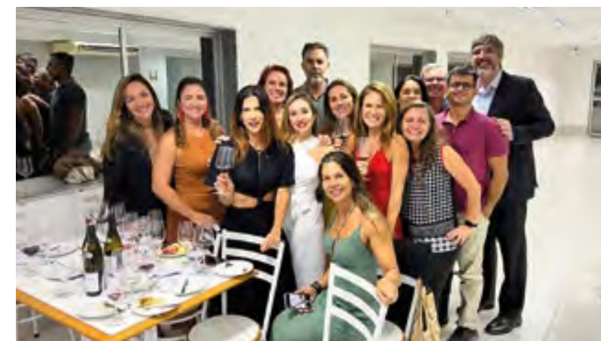
Promotores reunidos em Niterói apreciaram os vinhos do Rhône