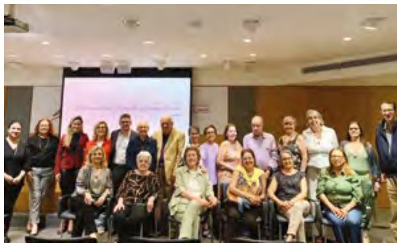
Participantes do já tradicional Reencontro dos Aposentados estiveram na confraternização realizada na sede da Amperj