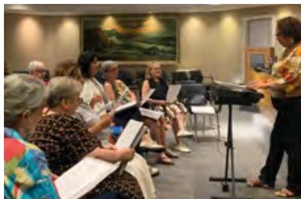
Coral da Amperj ensaia para a apresentação dos coros em concerto