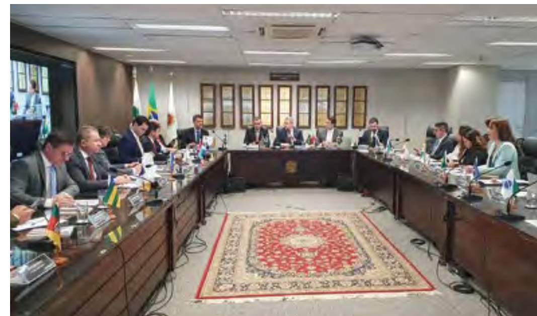
Conselheiros da Conamp discutem o PL da atividade de risco